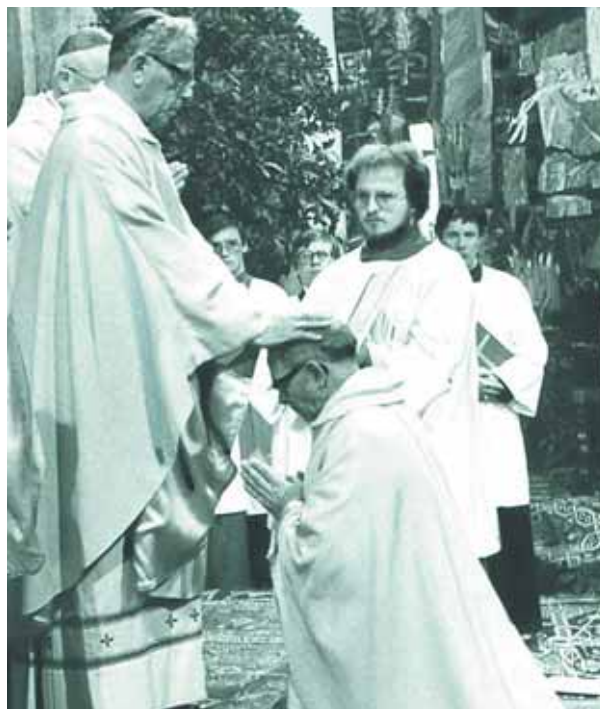
Die Begegnung zweier Welten - Bischof Paulus Rusch prägte die Kirche in den Jahren des Wiederaufbaus, Reinhold Stecher ging „in die Arena“ und kämpfte für seine Kirche angesichts der Herausforderungen einer pluralen Welt.

Ich glaube, dass man sich als emeritierter Bischof vollständig von allen Leitungsaufgaben