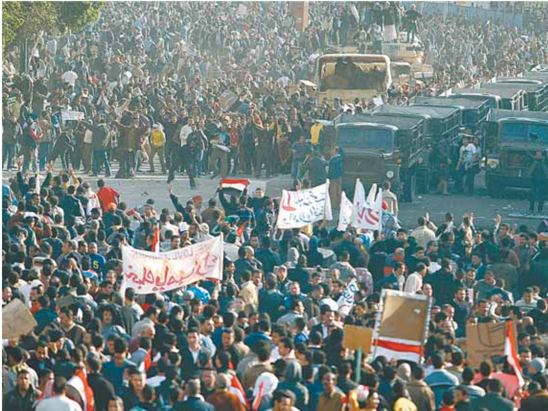
Was als friedliche Demonstration vergangene Woche auf dem Tahrir-Platz im Zentrum Kairo begann, endete mit massiven Zusammenstößen zwischen Mubarak-Gegnern und Mubarak-Anhängern. Mehrere Menschen sind dabei verletzt oder getötet worden.

zusammen. Ägypten importiert fast 80 Prozent seiner gesamten Grundnahrungsmittel, die Weizenpreise sind im vergangenen Jahr um 55 Prozent gestiegen. Da braucht man sich hier nicht weiter ausmalen, was dem Land noch drohen könnte, sollte hier nicht möglichst rasch eine neue politische Ordnung, eine Basis da sein, auch mit einer gewissen Unterstützung weiterhin von außen, weil das Land nicht kurzfristig seine gesamte Ordnung umstellen kann. Als unter anderem der damalige ägyptische Präsident Anwar as-Sadat in den 70er Jahren den Friedensvertrag mit Israel abgeschlossen hat, war das nicht nur der idealistische Entschluss, mit dem Gegner Frieden zu schließen, sondern Sadat war sehr klar berechnend auf Wirtschaftshilfe aus den USA aus. Auf die war man damals schon massiv angewiesen und ist es heute noch, sonst wäre der ägyptische Staatshaushalt nicht zu finanzieren.