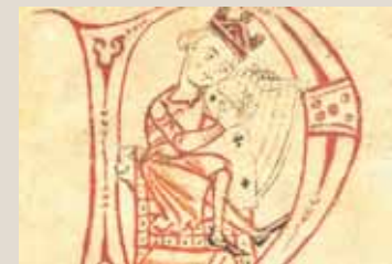
Spirituelle Erfahrungen der frühen Zisterzienser in einem Buch.

► Wolfgang Buchmüller: Ein Lied, das froh im Herzen jubelt. Be & Be Verlag Heiligenkreuz, S 224, € 15,60.-