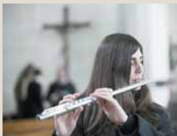
Flötist des „Ensemble Lindenthal“